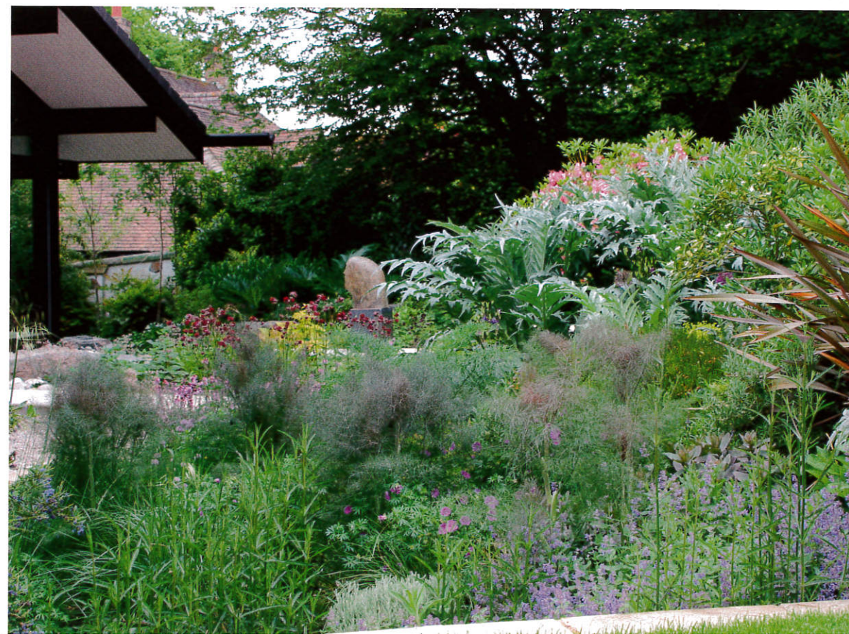
Kontrastreich: Wolfsmilch, Purpurfenchel, Iris und Mahagoni- Kirsche.