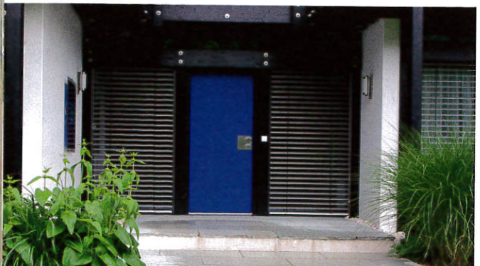
Schlichtes «Empfangskomitee»: Miscanthus 'Gracillimus' (rechts) und Brandkraut (Phlomis).

INFO Das Familienunternehmen «Huf Haus» gibt es seit 1912 und wird heute in dritter Generation weitergeführt. In Deutschland und in der Schweiz ist das «Huf Haus» bereits mehrfach mit dem «Haus des Jahres» ausgezeichnet worden. Das «Huf Sonnen Haus» erhielt den deutschen Solarpreis, weil es als erstes CO 2 -neutrales Fachwerkhaus vollständig mit erneuerbaren Energiequellen versorgt werden kann. Die Hauptzentrale ist im deutschen Hartenfels. Für die Schweiz wende man sich an: Huf Musterhauszentrum, Brunnwis-Strasse 14, 8604 Volketswil-Kindhausen, Telefon 044 946 15 25 und www.huf-haus.ch